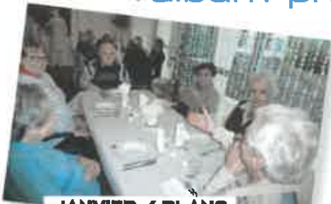
JANVIER / BLANC

L'été, ces repas sont suspendus pour laisser place aux pique-niques, apéritifs et repas au jardin.