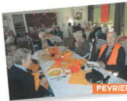
FEVRIER / ORANGE