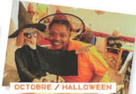
OCTOBRE / HALLOWEEN