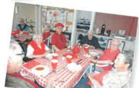
JUIN / ROUGE