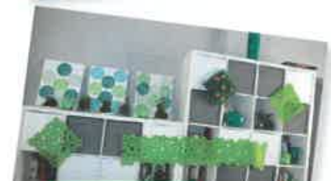
MARS / VERT