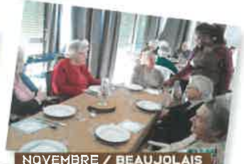
NOVEMBRE / BEAUJOLAIS