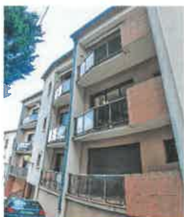
Résidence Rec des Auriols