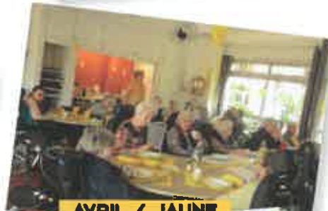
AVRIL / JAUNE