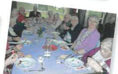
MAI / MAUVE